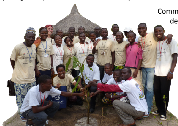
Plantation du manguier des Clubs Nature du Boundou aux 2 e Rencontres des clubs CPN africains au Bénin

De quoi alimenter nos clubs nature pendant des années !