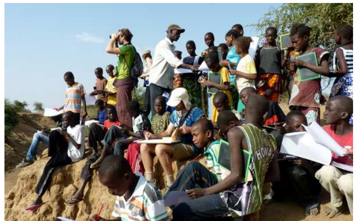
Classe de Sansanding lors d'un atelier dessin sur la Falémé

Plus d'infos... http://assoboree.canalblog.com/