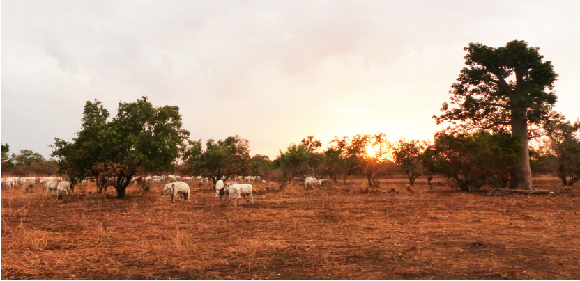
Figure 3. Mania Dala, savane herbacée brûlée au milieu d'une savane arborée (RNC du Boundou, 4 nov 2015)

L'espèce a une répartition très large, du Mali au Sud-Soudan (Borrow & Demey 2001). La Sénégambie se trouve à l'extrémité occidentale de son aire de répartition, où les observations sont rares. L'espèce n'est pas relevée dans le bilan des observations notables au Sénégal de 1984 à 1994 (Sauvage & Rodwell 1998), ni mentionnée pour le Sénégal par Borrow & Demey (2011). Il existe cependant deux observations qui n'ont pas été publiées, relevées au Parc National du Niokolo Koba, Sénégal, c. 120 km au sud-ouest de Mania Dala, l'une en février 1985 (R. Demey in litt. 2016), l'autre en novembre 1992 par P. Delaporte ( in litt. 2016). Par ailleurs il y a une mention en 1961 en Gambie: "1 sujet, sans doute le même, près de Banjul 31 déc. 1960 et 1er–8 janv. 1961" (Morel & Morel 1990).