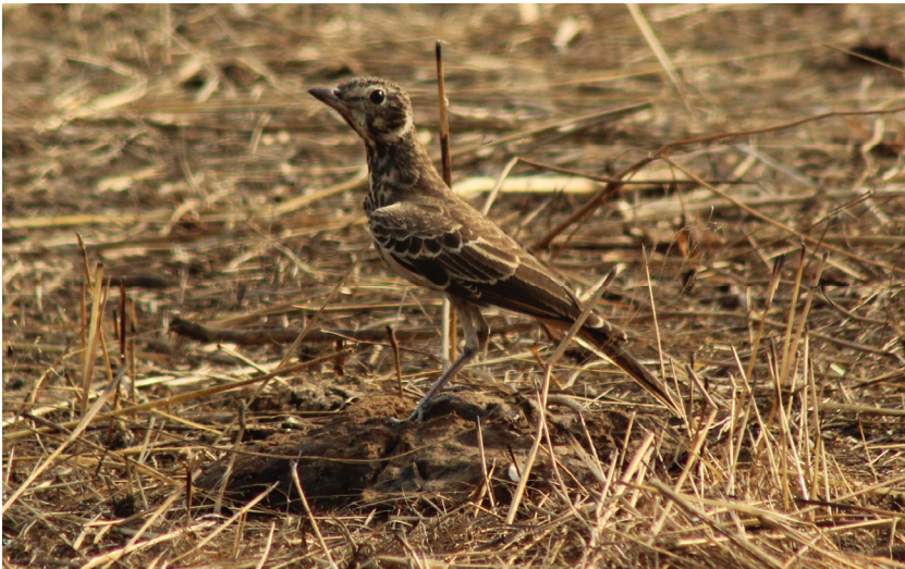
Figure 1. Alouette à queue rousse Pinarocorys erythropygia , Mania Dala (Réserve Naturelle Communautaire du Boundou, Sénégal Oriental), 11 nov 2015.

Au sol, c'est sa taille moyenne, ses longues pattes et sa silhouette haut-perchée qui ont en priorité retenu notre attention. Ensuite, son collier et son sourcil crème, sa poitrine claire et son croupion roux permettent de préciser l'identification. Son bec court et fort est également un critère notable. Parmi les autres espèces d'Alaudidés, peu